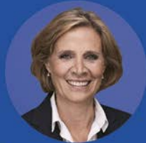
Patricia von Falkenstein Nationalrätin, Präsidentin LDP Basel-Stadt